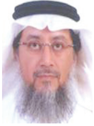
والحجر كموقع تراث عالمي.